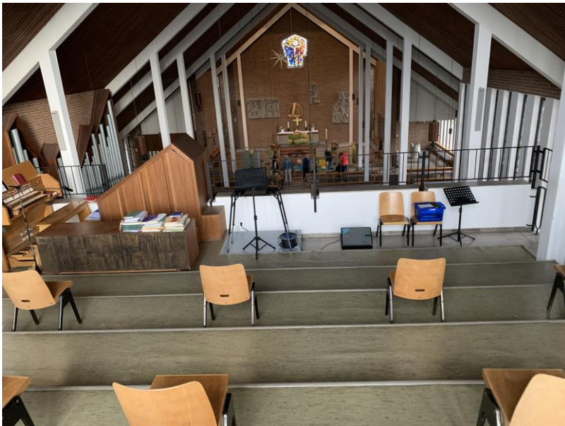
Empore von oben