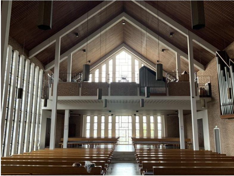
Orgelempore aus Sicht